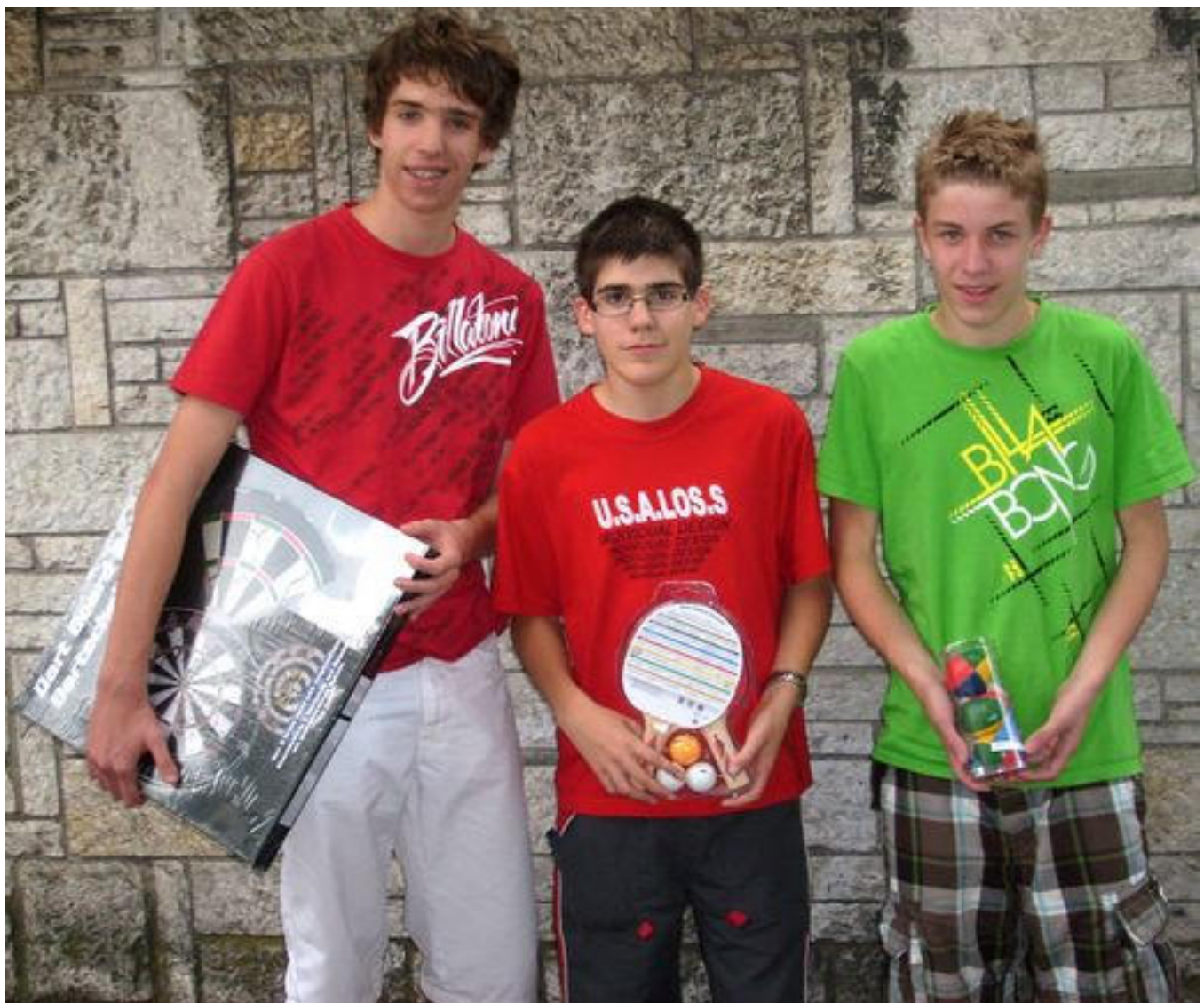
Siegerfoto Kategorie U18: